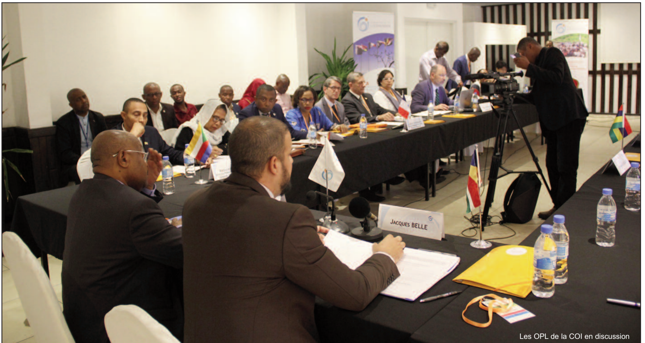
Les OPL de la COI en discussion