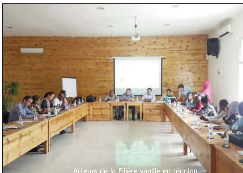
Acteurs de la Filière vanille en réunion