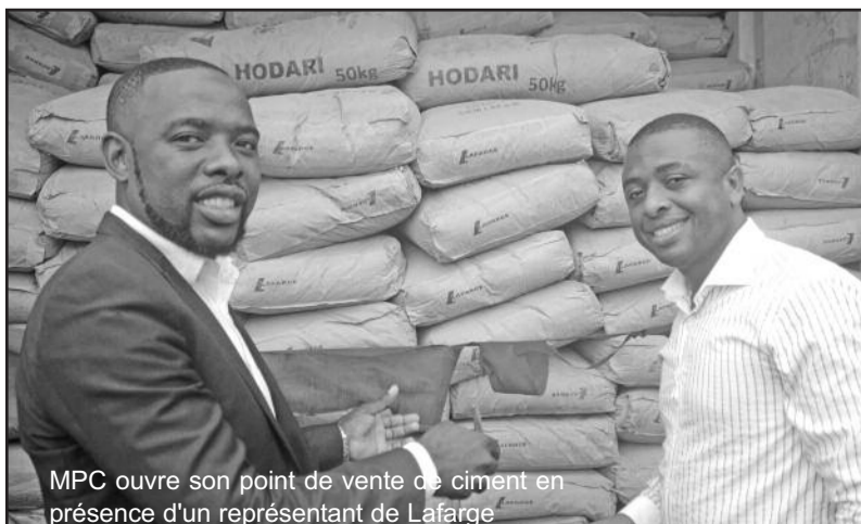
MPC ouvre son point de vente de ciment en présence d'un représentant de Lafarge

La société à responsabilité limitée MPC a tenu une conférence de presse, hier jeudi 1er août à Voidjou pour présenter un accord qui le lie à la société Lafarge pour la commercialisation du ciment dans l'archipel.