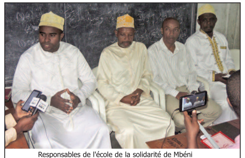
Responsables de l'école de la solidarité de Mbéni